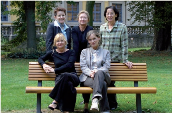
(Abb. hauptamtliche Mitarbeiter, Stiftung Juliusspital)

Unserem Leitbild entsprechend legen wir besonderen Wert auf eine individuelle Betreuung unter Berücksichtigung der jeweiligen Lern- und Lebensbiographie